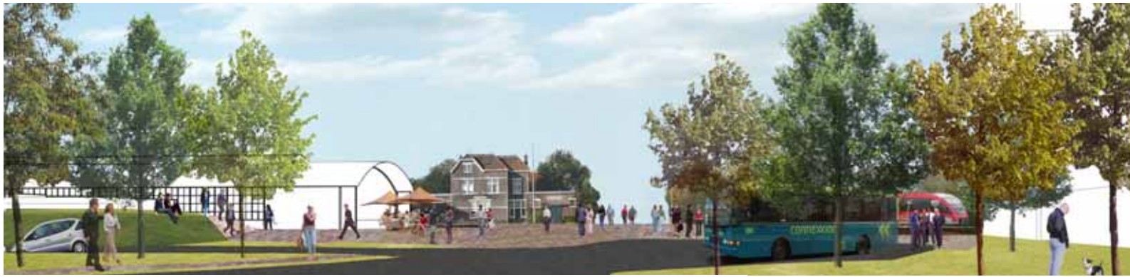
Intryck med vy över OV-torget