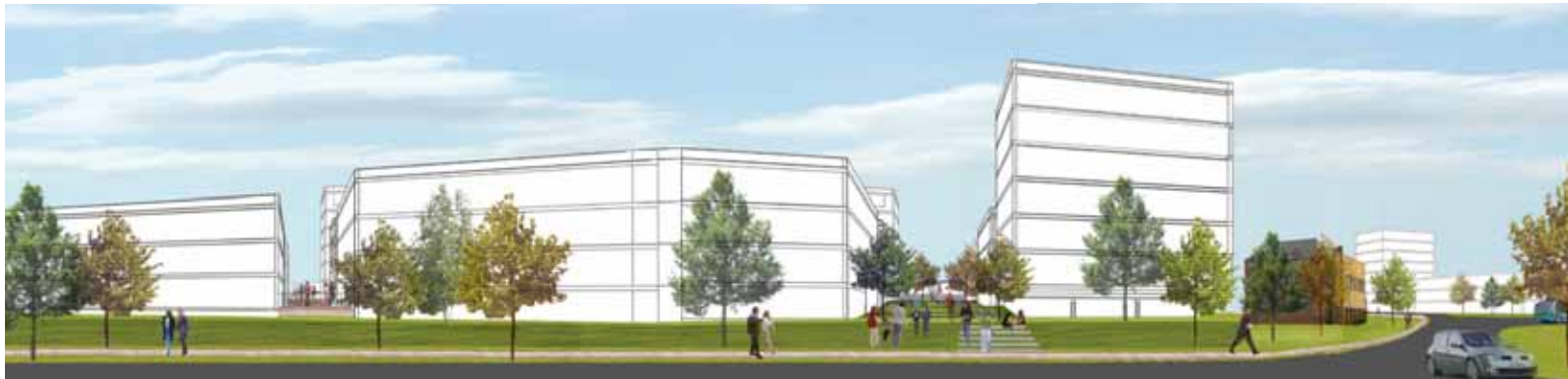
Intryck av komplexets gröna ytterkant