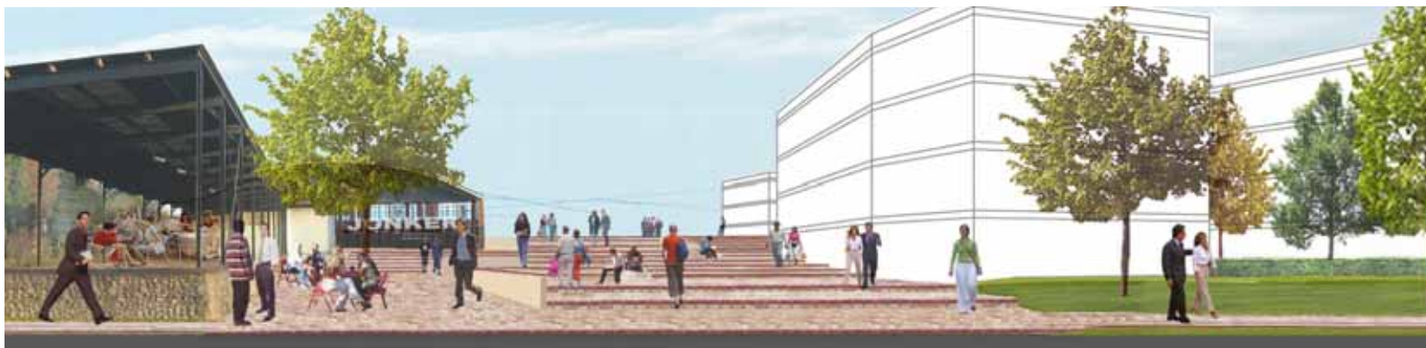
Intryck av trappor längs Jonkerloods